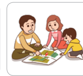
3 가족 간의 비상시 연락방법과 대피장소를 미리 지정