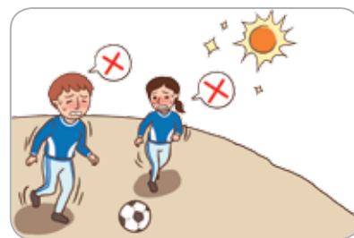
3 더운 시간대에 휴식을 취한다.(운동장 등 실외활동을 자제한다.)