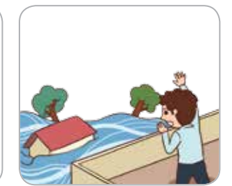
4 안전한 곳으로 대피하여 구조를 요청