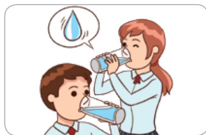
1 물을 자주 적당히 마신다.