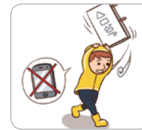
2 걸어가는 중에는 스마트폰 사용을 자제하고 주변을 경계