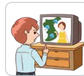
1 방송 매체를 통해 기상상황을 확인